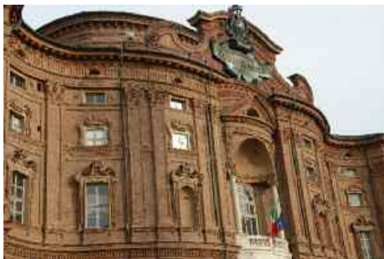
Novembre: Palazzo Carignano, Torino