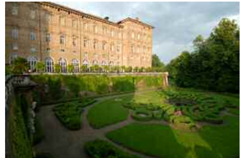
Giugno: Castello Ducale di Agliè (TO)