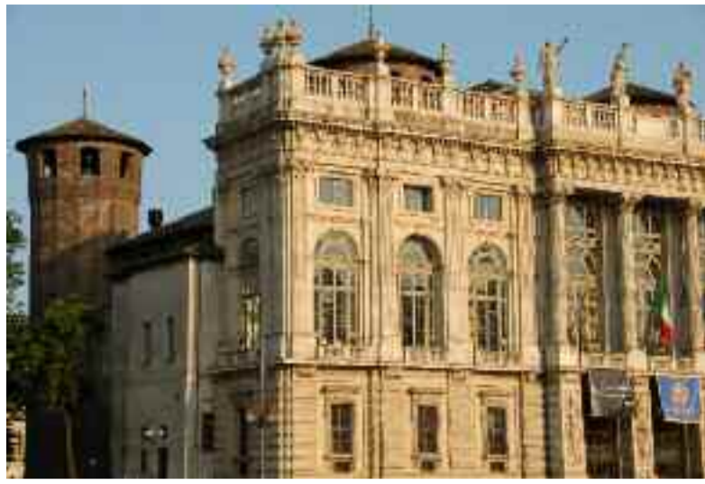
Palazzo Madama, Torino