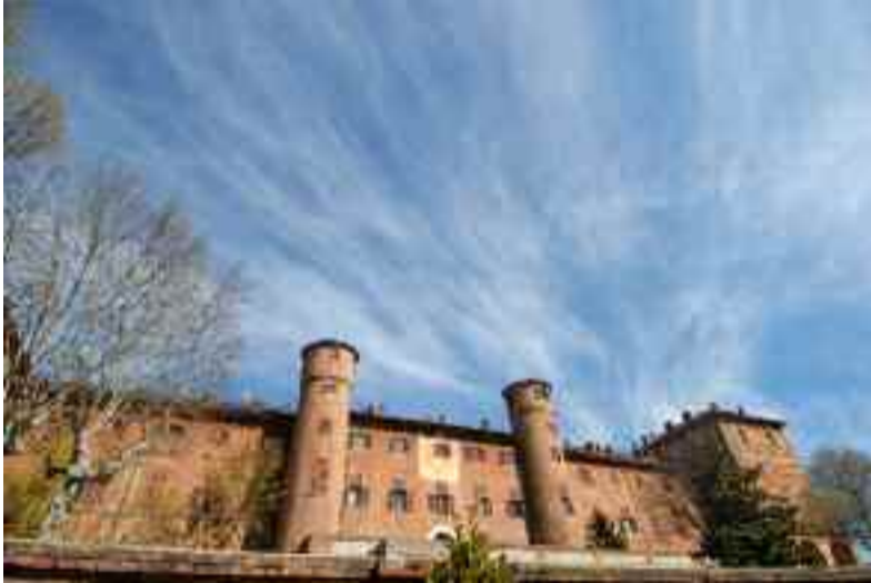
Gennaio: Castello di Moncalieri (TO)