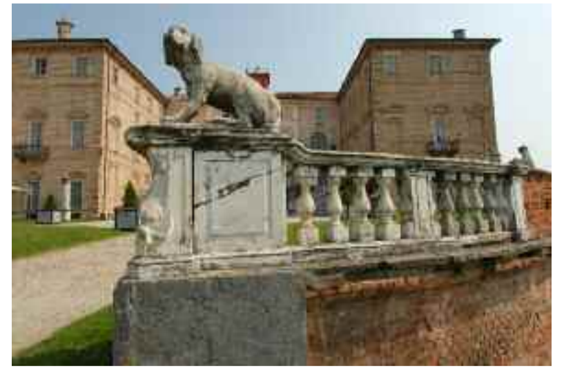
Castello di Govone (CN)