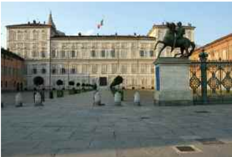
Aprile: Palazzo Reale, Torino