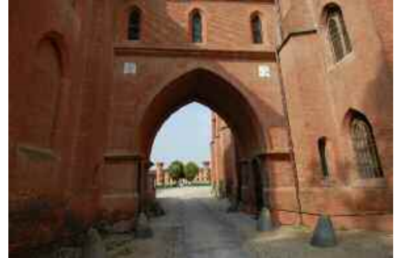
Marzo: Castello di Pollenzo (CN)