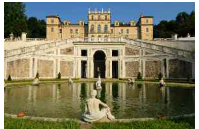
Settembre: Villa della Regina, Torino