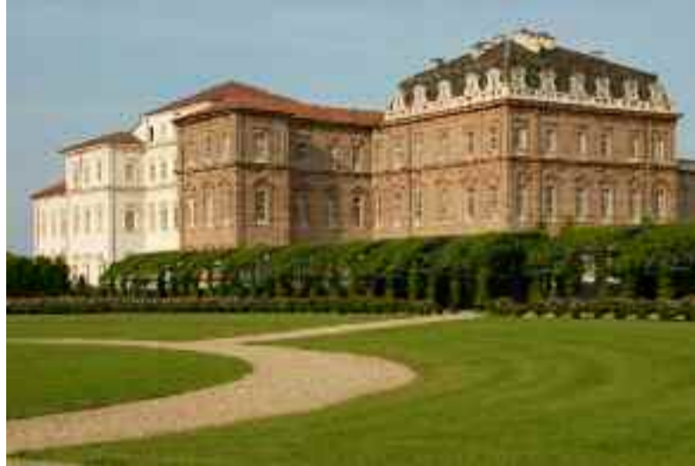
Febbraio: Reggia di Venaria Reale (TO)