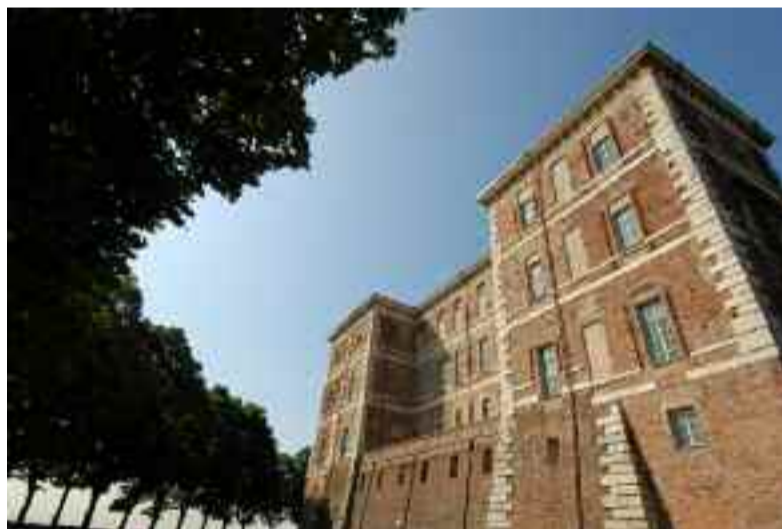
Agosto: Castello di Rivoli (TO)