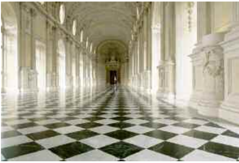
Copertina: Reggia di Venaria Reale (TO). La Galleria Grande detta "di Diana"