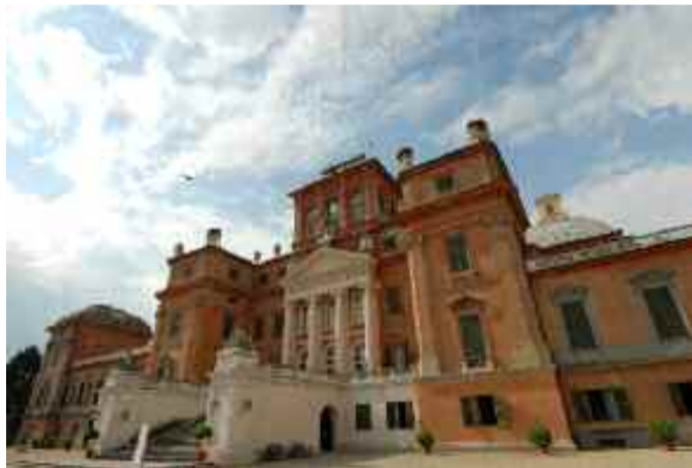
Maggio: Castello di Racconigi (CN)