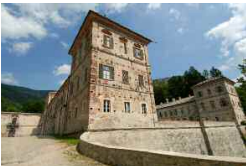
Ottobre: Castello di Casotto, Garessio (CN)