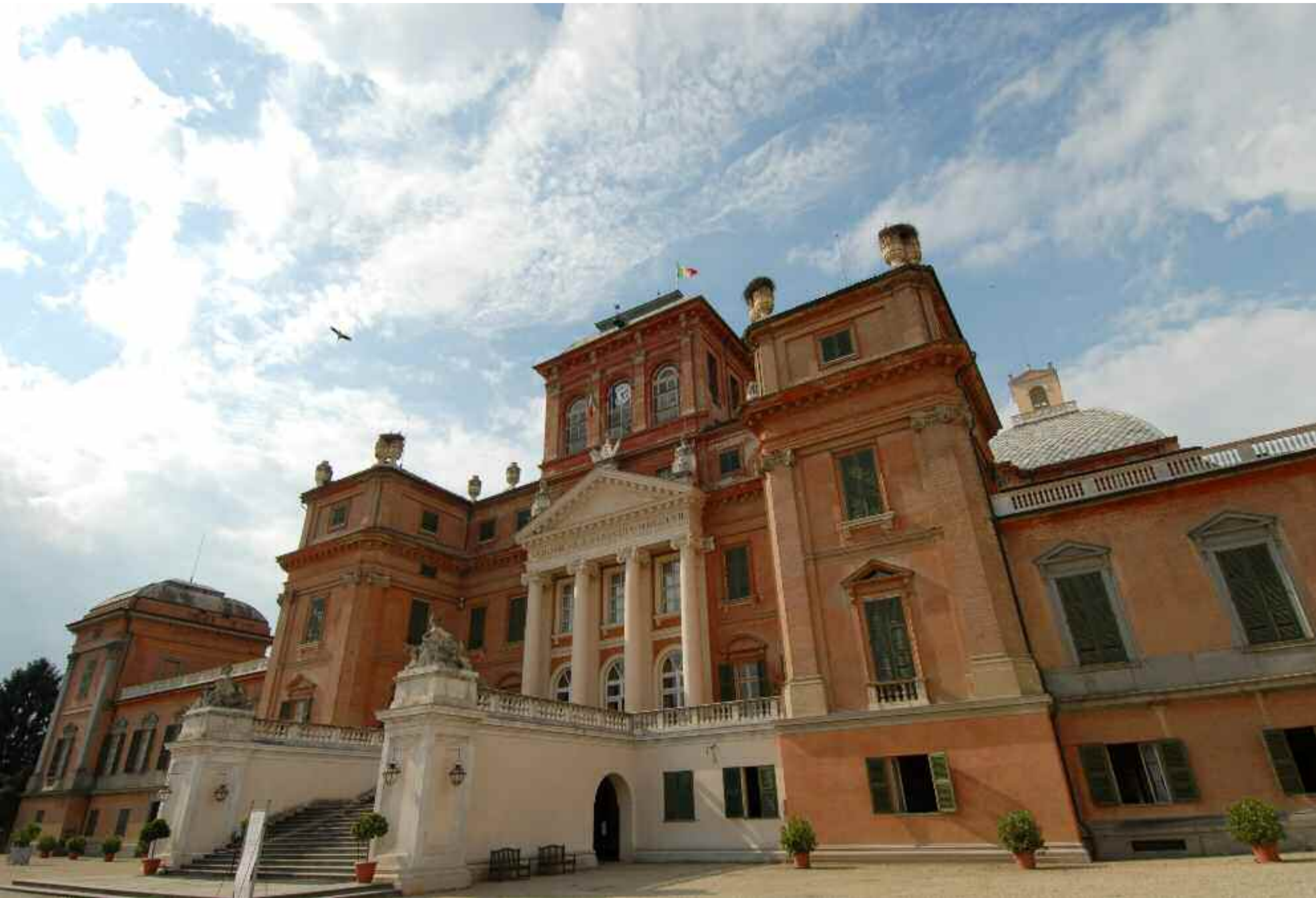
Castello di Racconigi (CN)