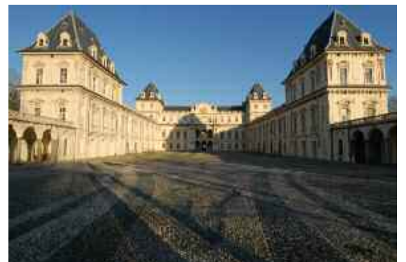
Dicembre: Castello del Valentino, Torino

Raffigurare l'eleganza, la raffinatezza, la sontuosità: questo il compito del fotografo davanti alla suggestione delle quattordici Dimore Sabaude del Piemonte. Fotografare la bellezza non basta. Parchi e palazzi, giardini e fontane, castelli e statue aspettano di essere interpretati nello spirito della nobiltà che li ha voluti e degli architetti che li hanno disegnati.