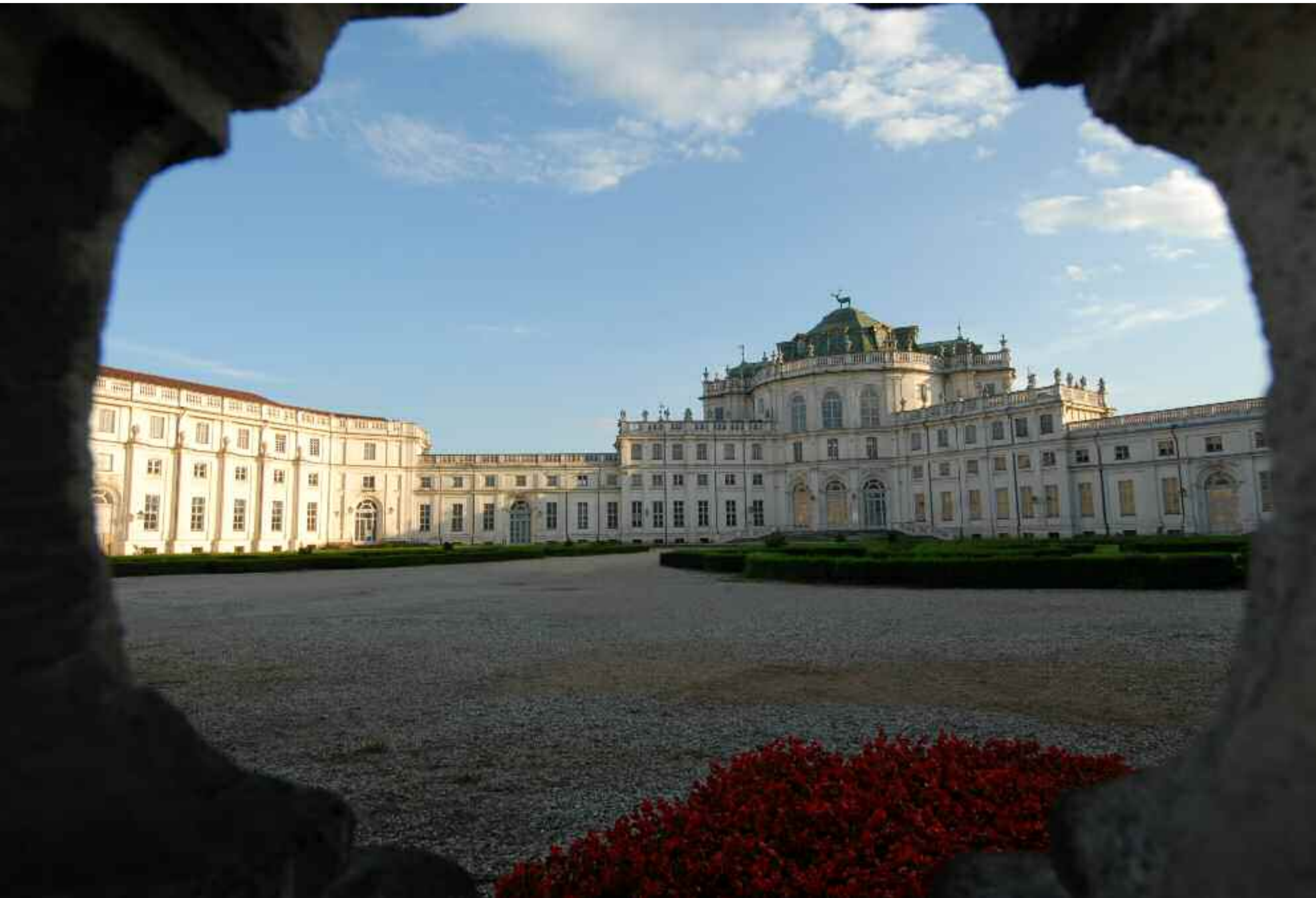
Palazzina di Caccia di Stupinigi (TO)