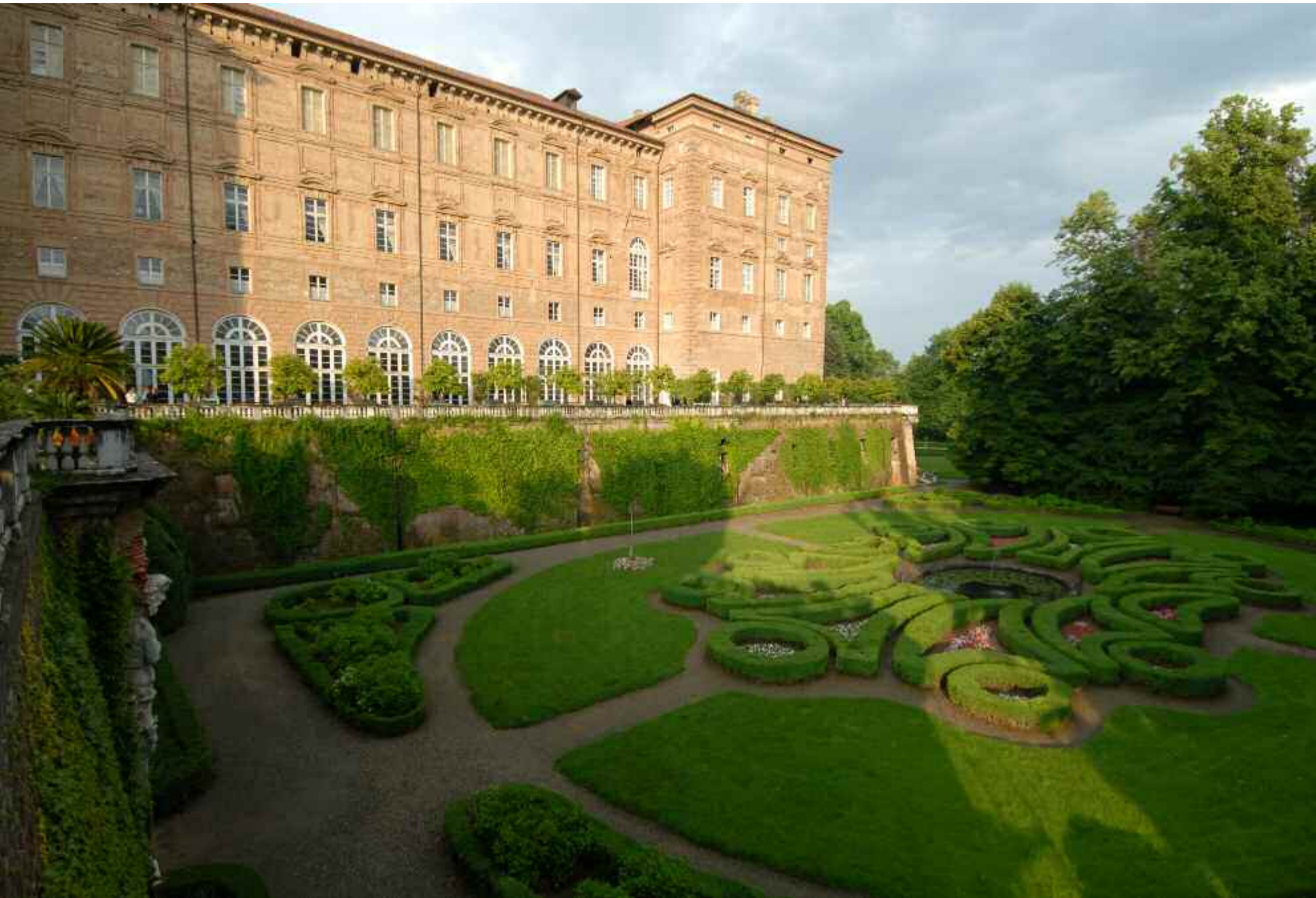
Castello Ducale di Agliè (TO)