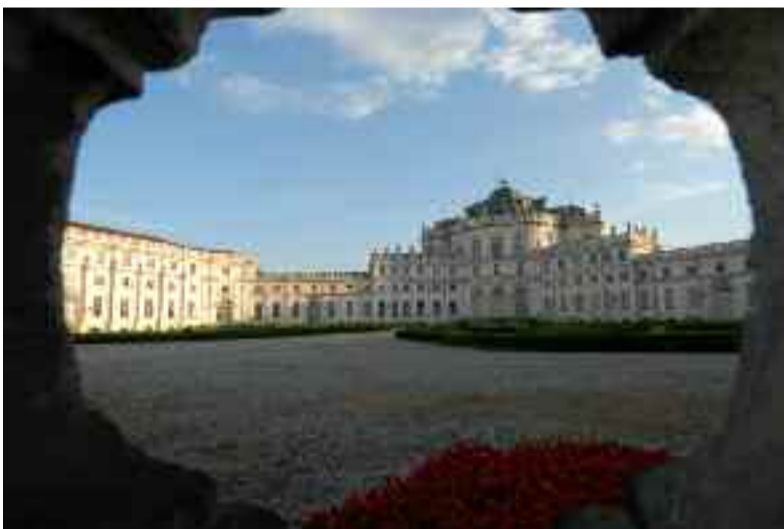
Luglio: Palazzina di Caccia di Stupinigi (TO)